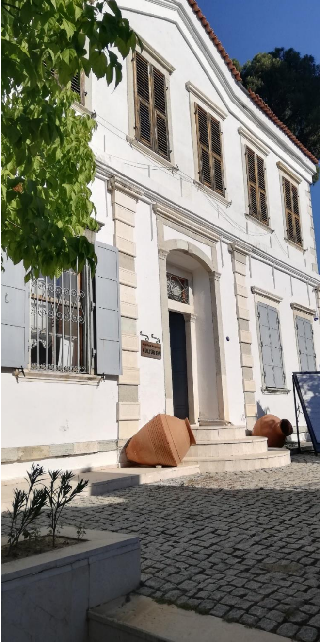
Ek-1: Yanyatır Ocağı Merkezi- Narlıdere. Yapılan restorasyondan sonra 'Narlıdere Kültür Evi' adıyla hizmet vermektedir (11.07.2019).