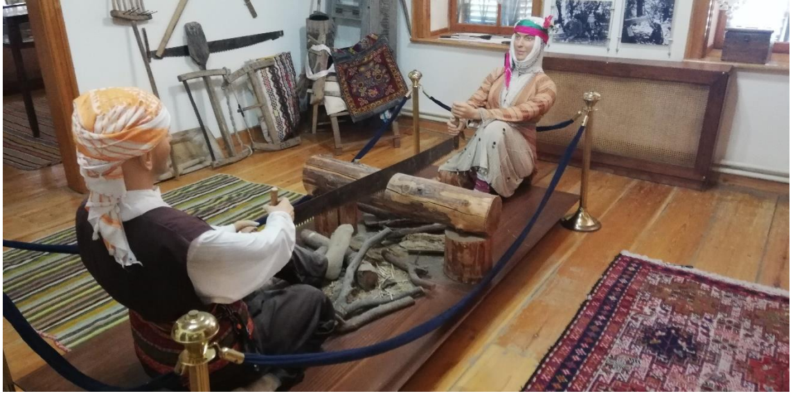
Ek-3: Tahtacıların tahta kesme işlemlerinden bir sahnenin canlandırılması- Narlidere Kültür Evi