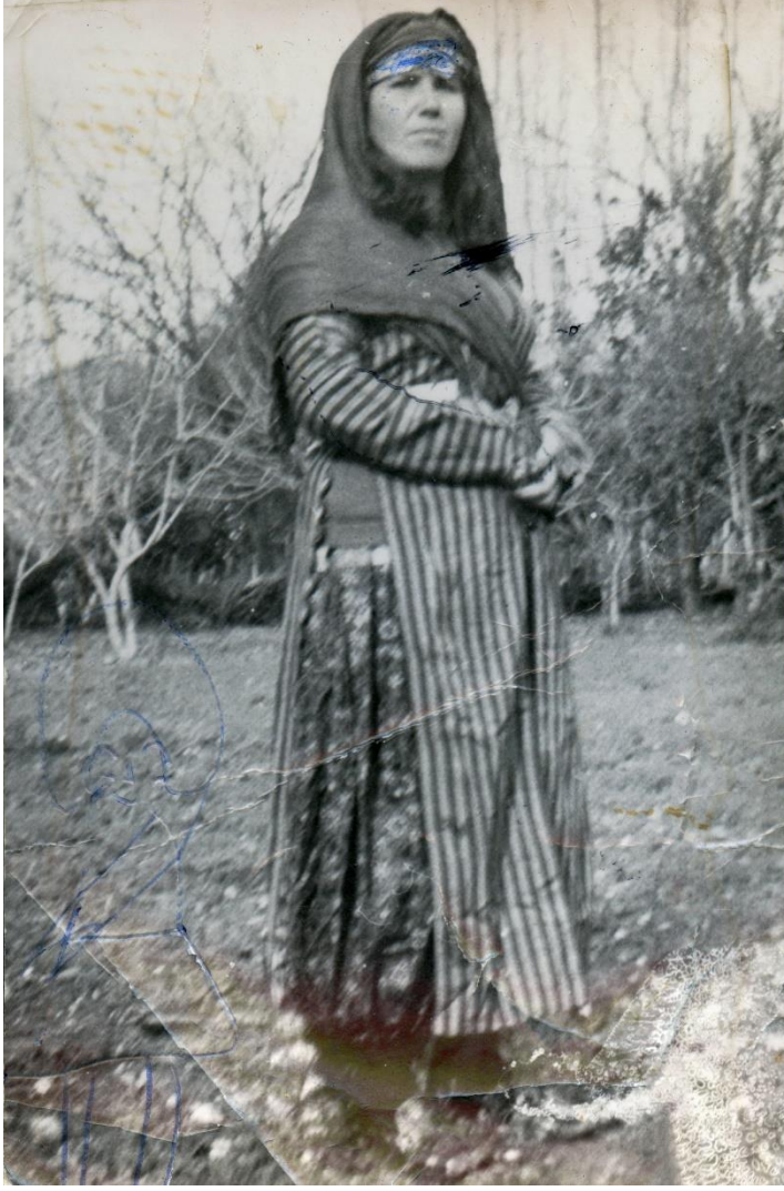
Resim 1.: Geleneksel 3 Etek kıyafetini giymiş bir Tahtacı kadını 79 .