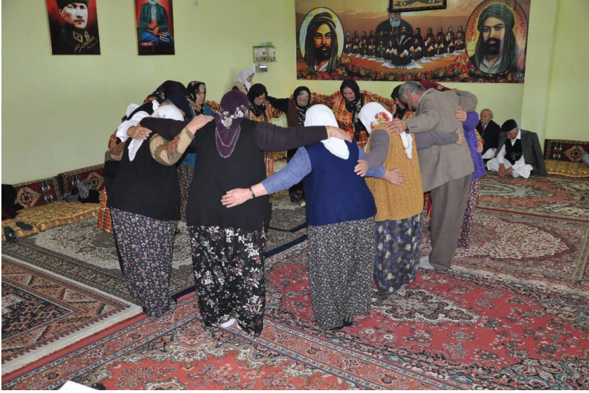
Fotoğraf 21: Veli Baba Sultan Ocađı, Semah Tamamlanınca Dualarını Alan Semahçılar