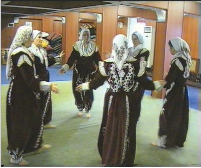
Fotoğraf 25: Eskişehir Seyitgazi Arslanbeyli Köyü, Dem Geldi Semahı Karşılama