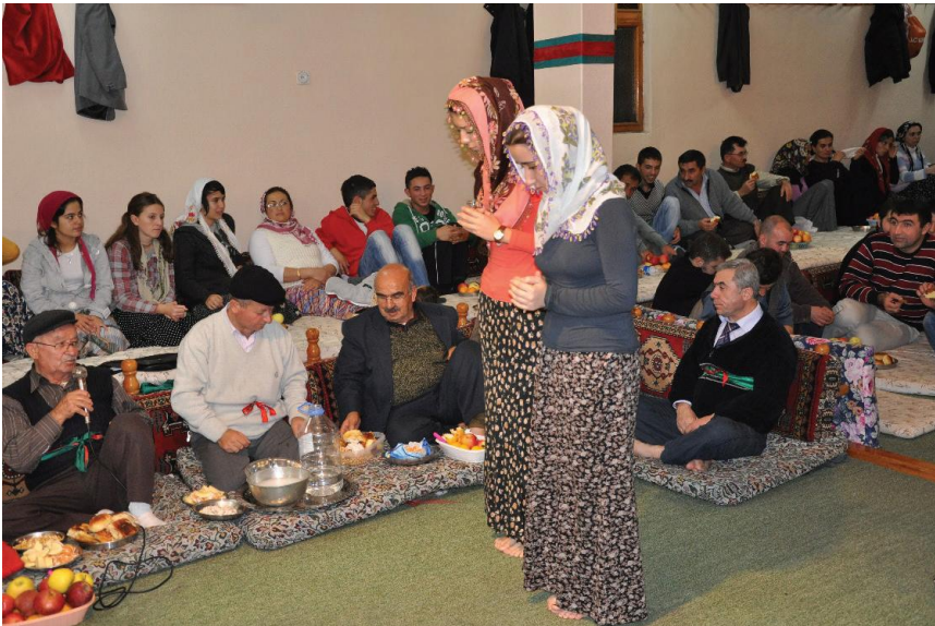
Fotoğraf 5: Çankırı Şabanözü Mart Köyü Sâki Yardımcısı İki Genç Kız