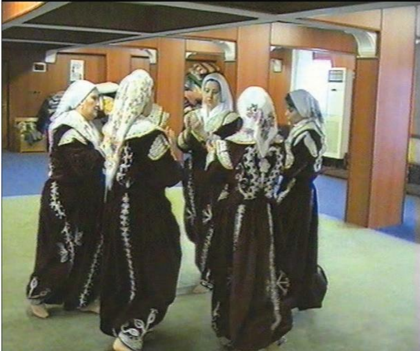
Fotoğraf 26: Eskişehir Seyitgazi Arslanbeyli Köyü, Dem Geldi Semahı Karşılama