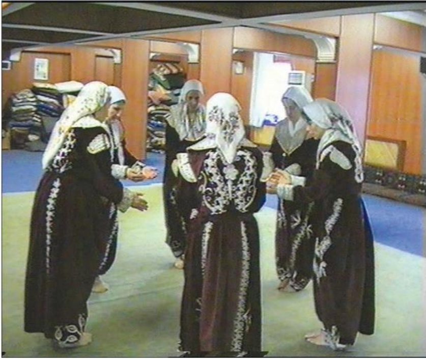
Fotoğraf 23: Eskişehir Seyitgazi Arslanbeyli Köyü, Dem Geldi Semahı Ağırlama