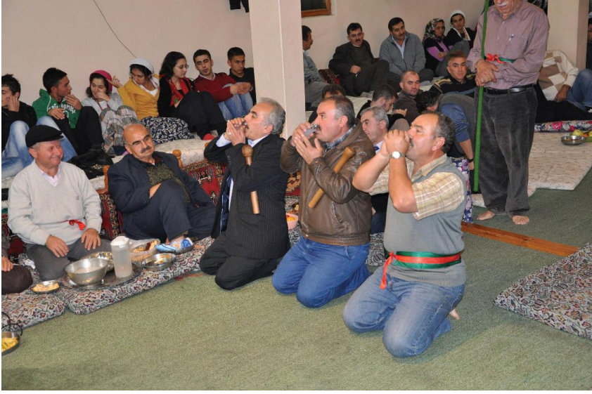
Fotoğraf 14: Çankırı Şabanözü Mart Köyü, Yasavur ve Pazvantlar Hizmet Dohusu Alırken