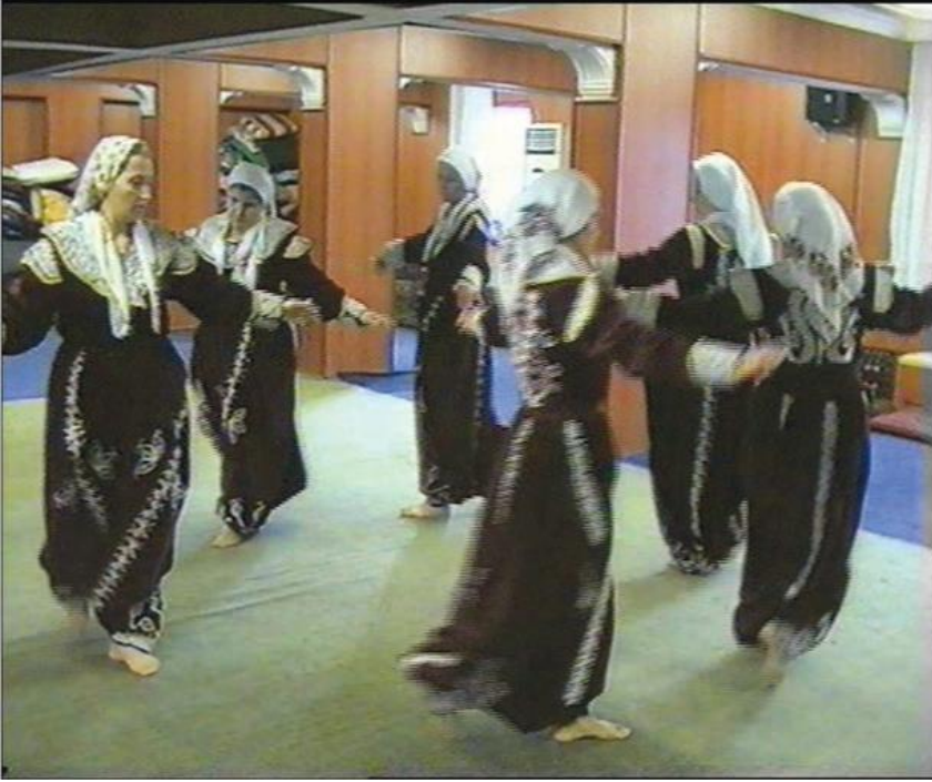
Fotoğraf 28: Eskişehir Seyitgazi Arslanbeyli Köyü, Dem Geldi Semahı Karşılama Pervaz Dönme