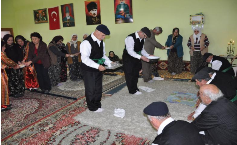
Fotoğraf 17: Demin Meydana Lokmalarla Birlikte Dualanmak Üzere Gelişi

“Bismişah Allah Allah, Ellerimiz dolu olsun, hep gönüller Ganî olsun. Yardımcımız Şâh-ı Merdan Ali olsun. Yiyenlere helâl, yediren canlara delil olsun. Kızıldeli, Akyazılı Sultan Efendimizin dem-i devranı yürüsün. Gerçeğe Hü!”