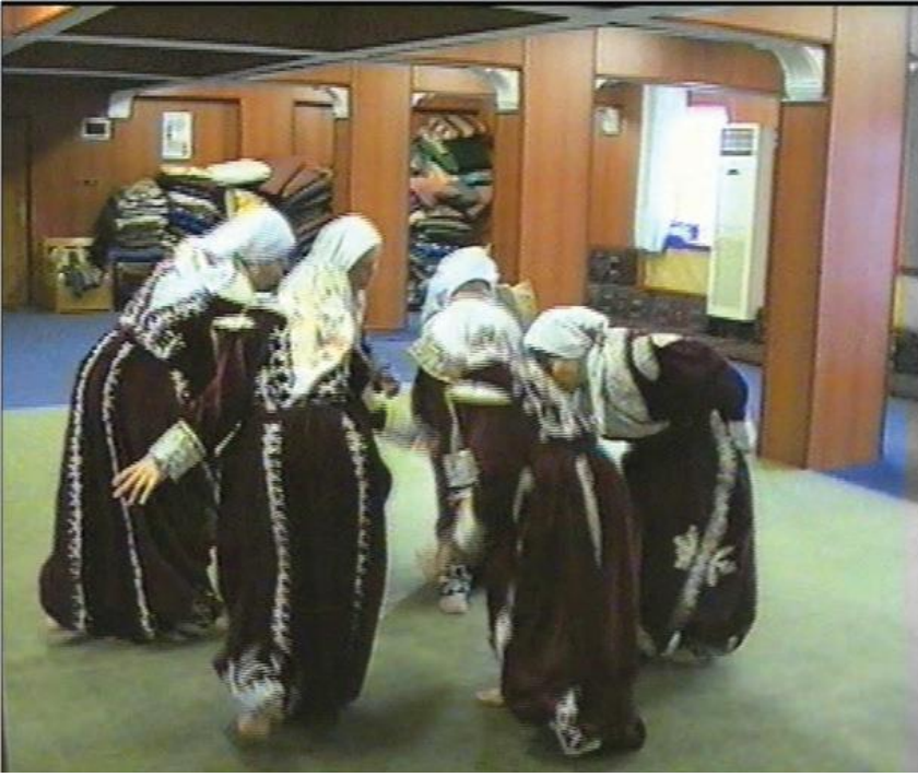
Fotoğraf 27: Eskişehir Seyitgazi Arslanbeyli Köyü, Dem Geldi Semahı Karşılama Yere Niyaz