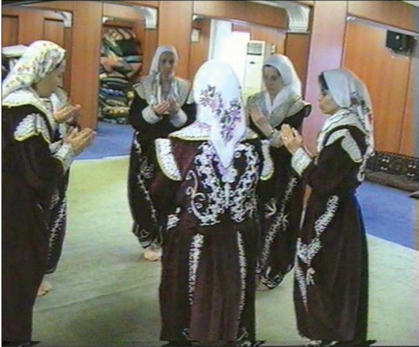
Fotoğraf 24: Eskişehir Seyitgazi Arslanbeyli Köyü, Dem Geldi Semahı Ağırlama