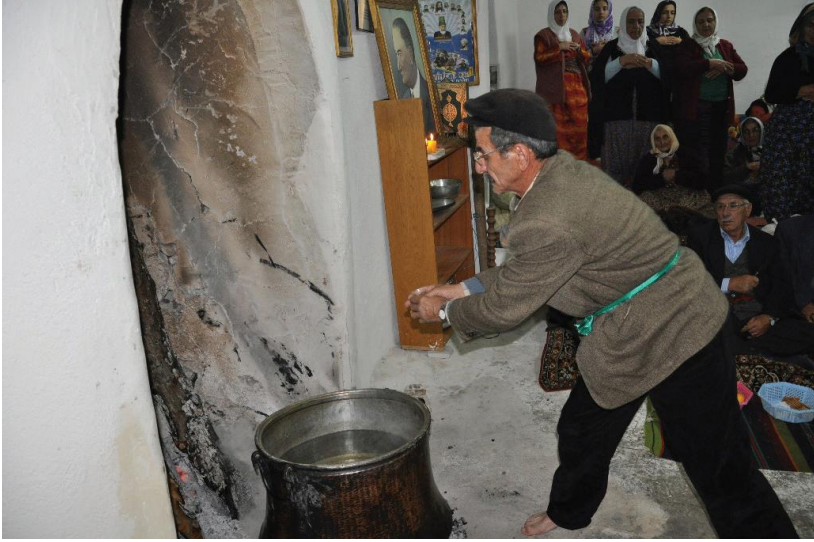
Fotoğraf 12: Ankara Çubuk Yukarı Emirler Köyü, Ocağa Dem Sunma (Gürgür Baba Dolusu)