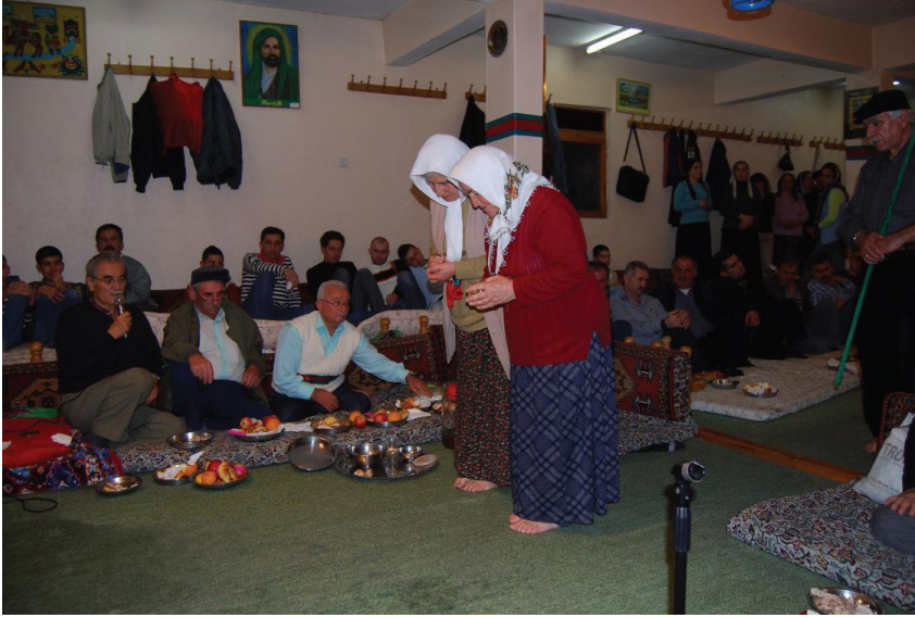
Fotoğraf 15: Çankırı Şabanözü Mart Köyü, Kadıncık Ana ve Gaip Erenler Dohusu Sunan Kadınlar

Bu inanç pratiklerinin sayısını arttırmak mümkündür. Biz, burada geleneksel inanç zümresinin deme bakışını izaha yetecek sayıda inanç pratiğini sunmaya çalıştık.