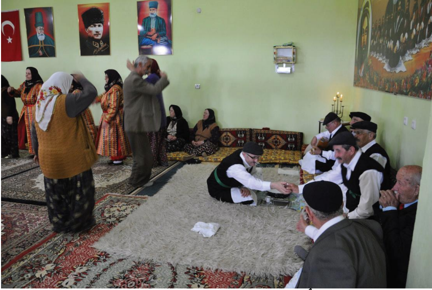
Fotođraf 19: Dem Geldi Semahı Dnlrken Aşıđın Okuduđu Nefeste Dem Sz Geçince Sâki Dem Dađıturken