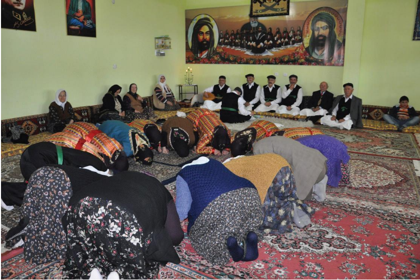
Fotoğraf 22: Veli Baba Sultan Ocađı Duadan Sonra Yere Niyaz Eden Semahçılar