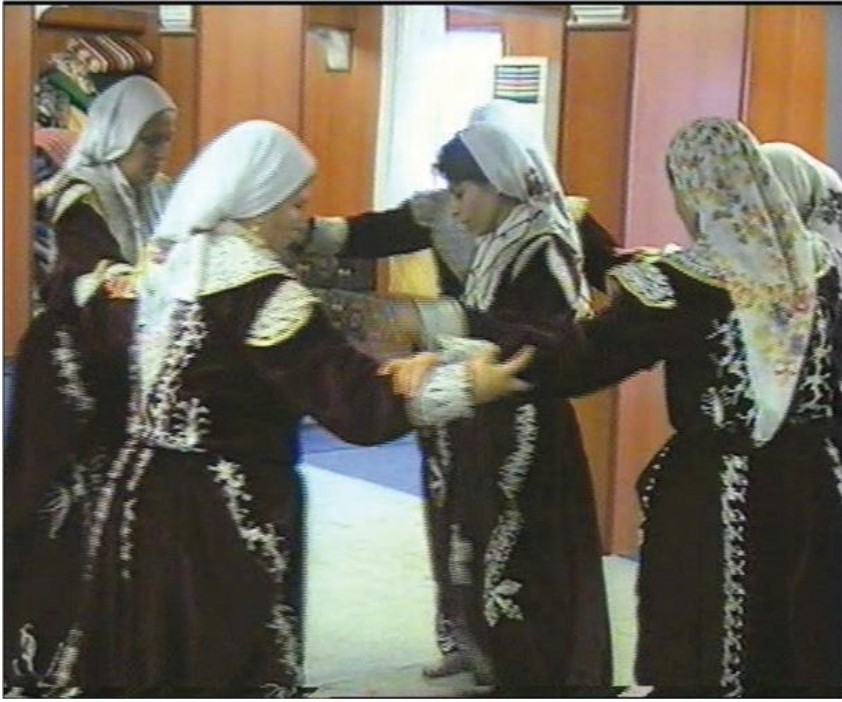
Fotoğraf 31: Hoplatma Dedeyi Temsilen Halkanın Ortasında Pervazcının Etrafında Elleri Kenetleyip Dönme