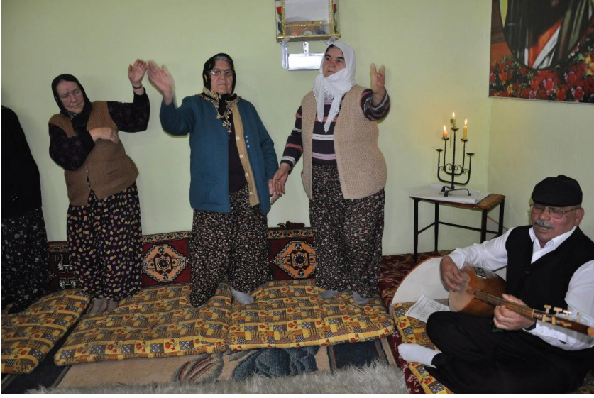
Fotođraf 18: Veli Baba Sultan Ocađı, Yerlerinde Ayađa Kalkarak Dem Geldi Semahı Dnen Kadın Talipler

Dede glbengini verince Eskişehir bölgesinde Scaeddin Veli Ocaklılarının Dem Geldi Semahı son bulur. Semahın hoplatma blmnde icra edilen eser ve icra şekli Alevi ocaklarında tespit ettiđimiz Kerbela Semahlarına benzemektedir. Semahın hoplatma kısmında Kerbela hadisesi ve orada Hz. Zeynelabidin'in Ehlibeyt kadınıları tarafından kurtarılışı canlandırılmaktadır.19