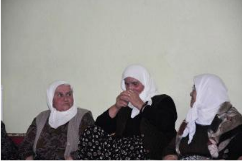
Fotoğraf 11: Isparta Senirkent Uluğbey Beldesi, Geçmişler Demi Alan Kadın Talip

Dem ile ilgili farklı bir pratiği de Tahtacı Alevilerinde tespit ettik. Tahtacı Alevilerinde ölüm merkezli birçok pratik vardır. Bunlardan bir kısmı da ölüm sonrası mezar başında icra edilmektedir. Çanakkale Ayvacık Uzunalan köyünde yaptığımız saha araştırmasında ölünün sevdiği meyve ve içeceklerin mezarına götürüldüğünü tespit ettik. Ölmeden önceki yaşantısında içkiyi seven bireylerin mezarının başına gidilerek içki içildiği ve her kadehte bir kabre içki döküldüğü kayıt altına alınmıştır. Mezar başında yemek yeme ve içki içme ile ilgili uygulamalara Çuvaş Türklerinde de rastlanılmaktadır (Güzel, 2015: 106).