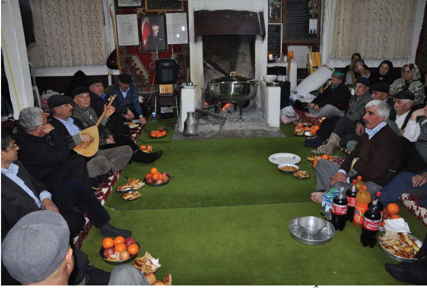
Fotoğraf 10: Ankara Kalecik Tavşancık Köyü, Âşık Dem Açma Nefesi Okurken

Geçmişler-İstekler Demleri: Isparta Veli Baba Sultan Ocağı'nda cemde “geçmişler demi” ve “istekler demi” adlı iki inanç pratiği daha uygulanmaktadır. Geçmişler demi, bireysel kurbanlarda cem meydanını ortaya getiren talibin geçmişlerin ruhu için dem alınmasıdır. Bu ritüel üzerinde önemle durulan bir ritüeldir. Cemde bulunan her talibin geçmişler deminden alması gerekir. Hiç içmeyenler bile kadehi eline alarak koklarlar. Demi almamak kurban sahibinin geçmişine saygısızlık olarak kabul görülür. İstekler demi ise dem hizmeti son bulmadan önceki son dem ritüelidir. Bu inanç pratiğinde de eski Türk inançlarına bir gönderme mevcuttur. İnanca göre meydana gelen her nesne meydan kapısından içeri girdikten sonra sır olmalıdır. Meydana gelen meydanda bitirilmelidir. Cem lokması dışarıya çıkarılmaz. Bu sebeple sâki dem hizmetini sonlandırmadan önce bütün ayin-i ceme “deme ganimisiniz?” diye sorar. İçlerinde istekli olanlar var ise kâsede kalan demi içmeleri için onlara sunar. Bu inanç pratiğine “istekler demi” denir.