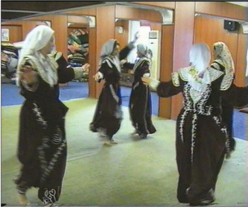
Fotoğraf 29: Dem Geldi Semahı Hoplatma Dedeyi Temsilen Halkanın Ortasında Pervaz Döner Semahçı