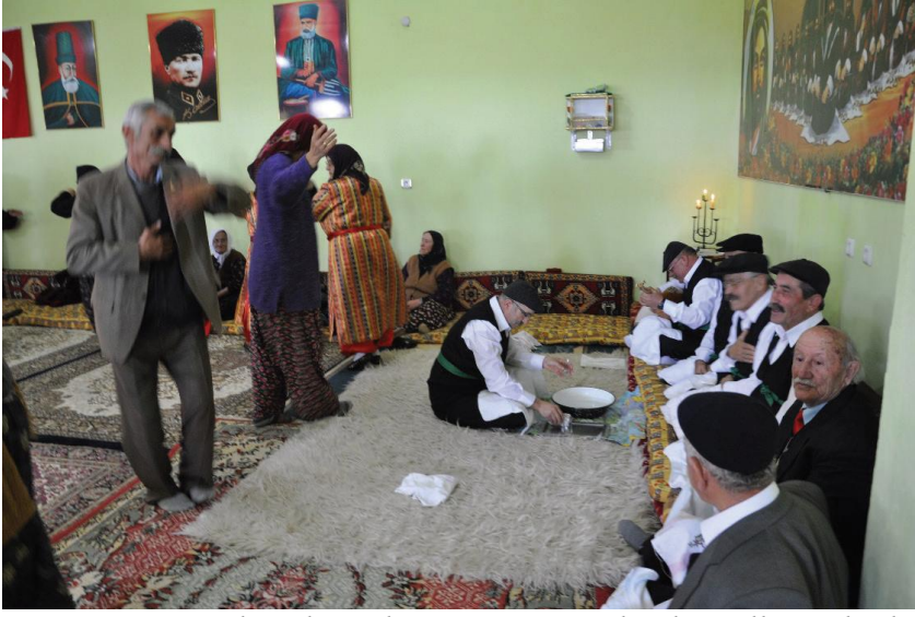
Fotoğraf 20: Veli Baba Sultan Ocađı, Meydanda Halka Halinde Semah Dönerlerden Bir Enstantane