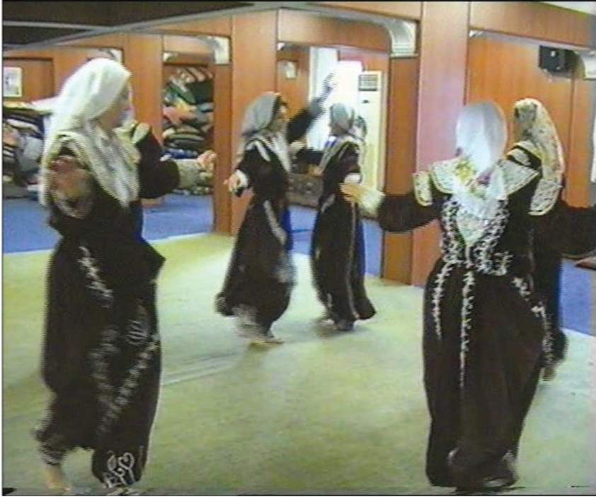
Fotoğraf 30: Hoplatma Dedeyi Temsilen Halkanın Ortasında Pervazcının Etrafında Elleri Kenetleyip Dönme